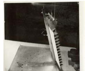
Slika 2. Pokus presjecanja težišnica pomoću modela sekcije poprečne pregrade tankera

Fig. 1 Testing of centroidal axes intersection by tank bottom section's model