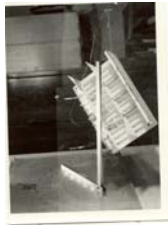
Slika 1. Pokus presjecanja težišnica pomoću modela sekcije dna tankera

Pomoću ovješanja modela sekcija prema slikama 01 i 02 u različitim točkama presjecišta ravnina Z - X i Y - Z i elemenata konstrukcije modela dobijemo dvije projekcije presjecišta težišnica modela, a time i koordinate težišta modela sekcije Z_T i X_T . Ako pomnožimo dobijene koordinate sa mjerilom modela dobijemo stvarne koordinate sekcije u naravnoj veličini. Svrha navedenog postupka je kontrola koordinata težišta sekcije dobijenim po formulama (1.2A), (1.2B) i (1.2C). Osim toga pokus presjecanja težišnica je uvod u računalnu simulaciju okretanja stvarne sekcije u postupku izrade u predmontažnoj radionici i kontrola proračuna koordinata težišta dobijenih po Varignon-ovom teoremu.