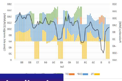
Modeliranje i simuliranje